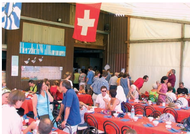
Viele Mitglieder sind erschienen ...

Seit Gründung des Vereins haben zahlreiche Freunde, Bekannte und Kolleginnen/Kollegen viel Zeit und Energie investiert, um in den verschiedensten Phasen der