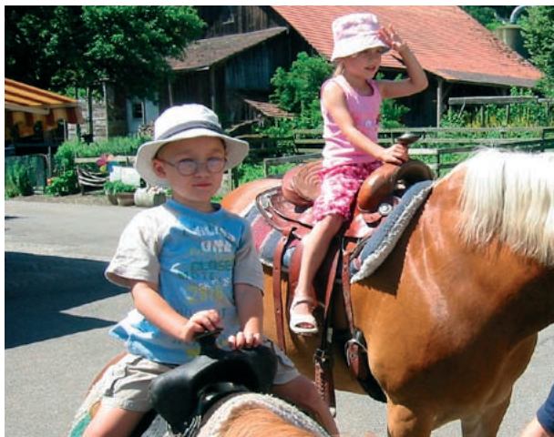
Abendteuer auf dem Bauernhof für unsere Kleinsten

Vereinsgeschichte das Beste für Pro Phalombe zu leisten. Es war für viele Vereinsmitglieder eine super Gelegenheit, sich mit all den Aktiven und Ehemaligen, die man teilweise auch aus den Augen verloren hatte, über vergan-